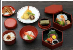
1日目:柿の葉ずしヤマト