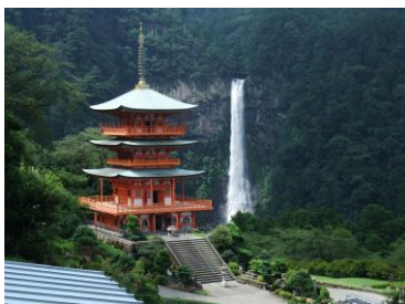
左:三重塔と那智の滝