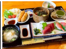
2日目:那智勝浦 大林