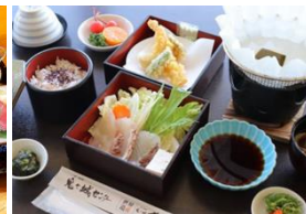
3日目:鬼ヶ城センター