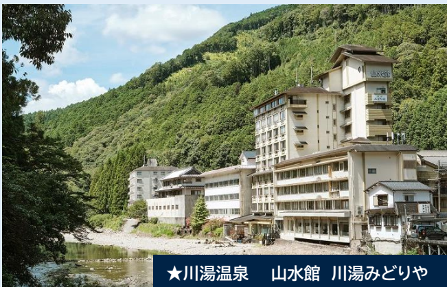
★川湯温泉 山水館 川湯みどりや