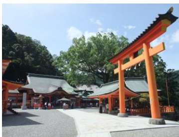
中央:熊野那智大社