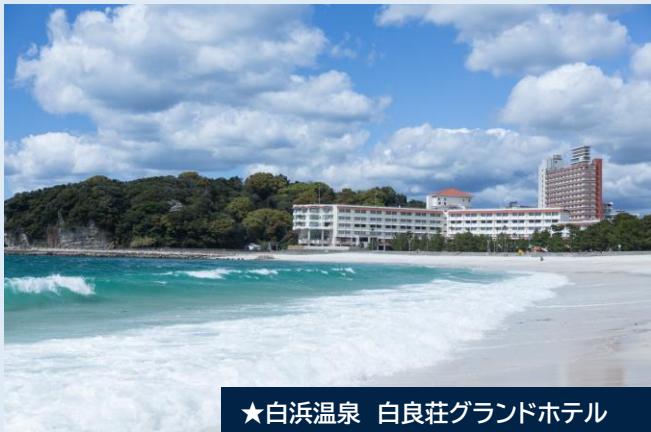
★白浜温泉 白良荘グランドホテル