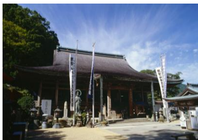
右:那智山青岸渡寺